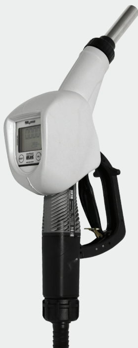
SB 325 METERED Part # F00617010

This kit allows you to transform a standard SB 325 nozzle into an SB 325 mis-filling system by simply fitting a different spout onto the nozzle. This feature prevents you from having a mis-fill into the fuel tank by working in conjunction with the magnetic bypass adapter. The nozzle will not engage if not used in the allocated tank.