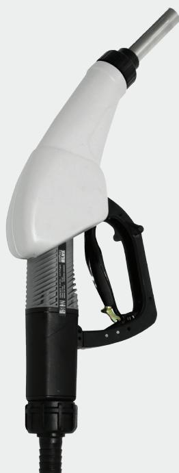
SB 325 AUTOMATIC Part # F00617000